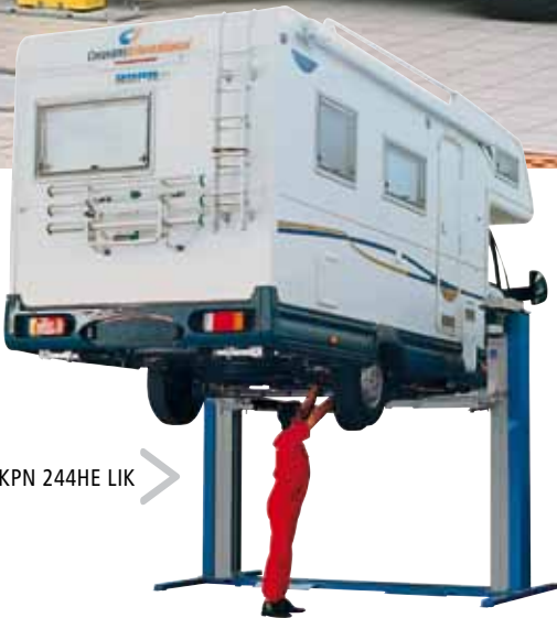
KPN 244HE LIK