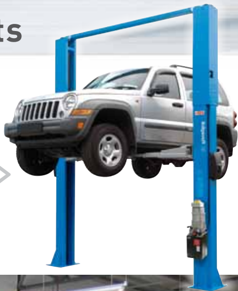
KPH 370.42 >