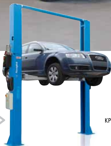
KPH 370.42LIK >