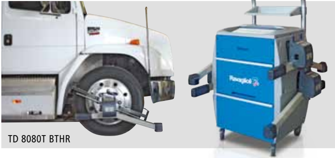
TD 8080T BTHR