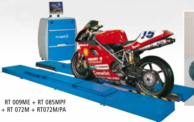
RT 009ME + RT 085MPF + RT 072M + RT072M/PA