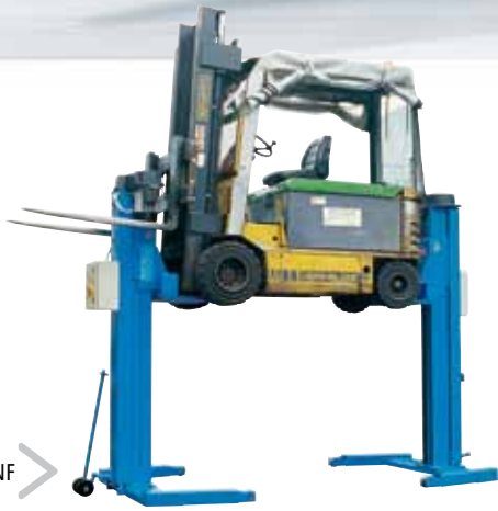
RAV 232 NF