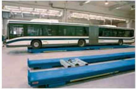
RAV 713 DUO