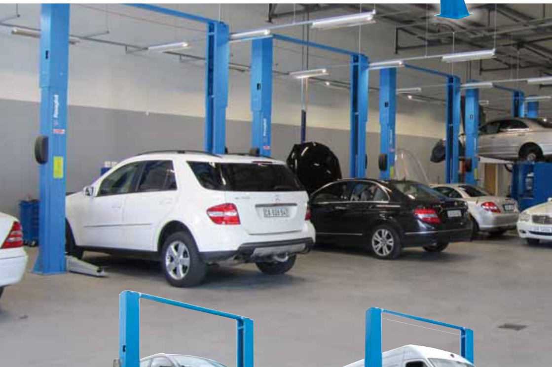
KPH 370.32 + VARKPH370.32/T >