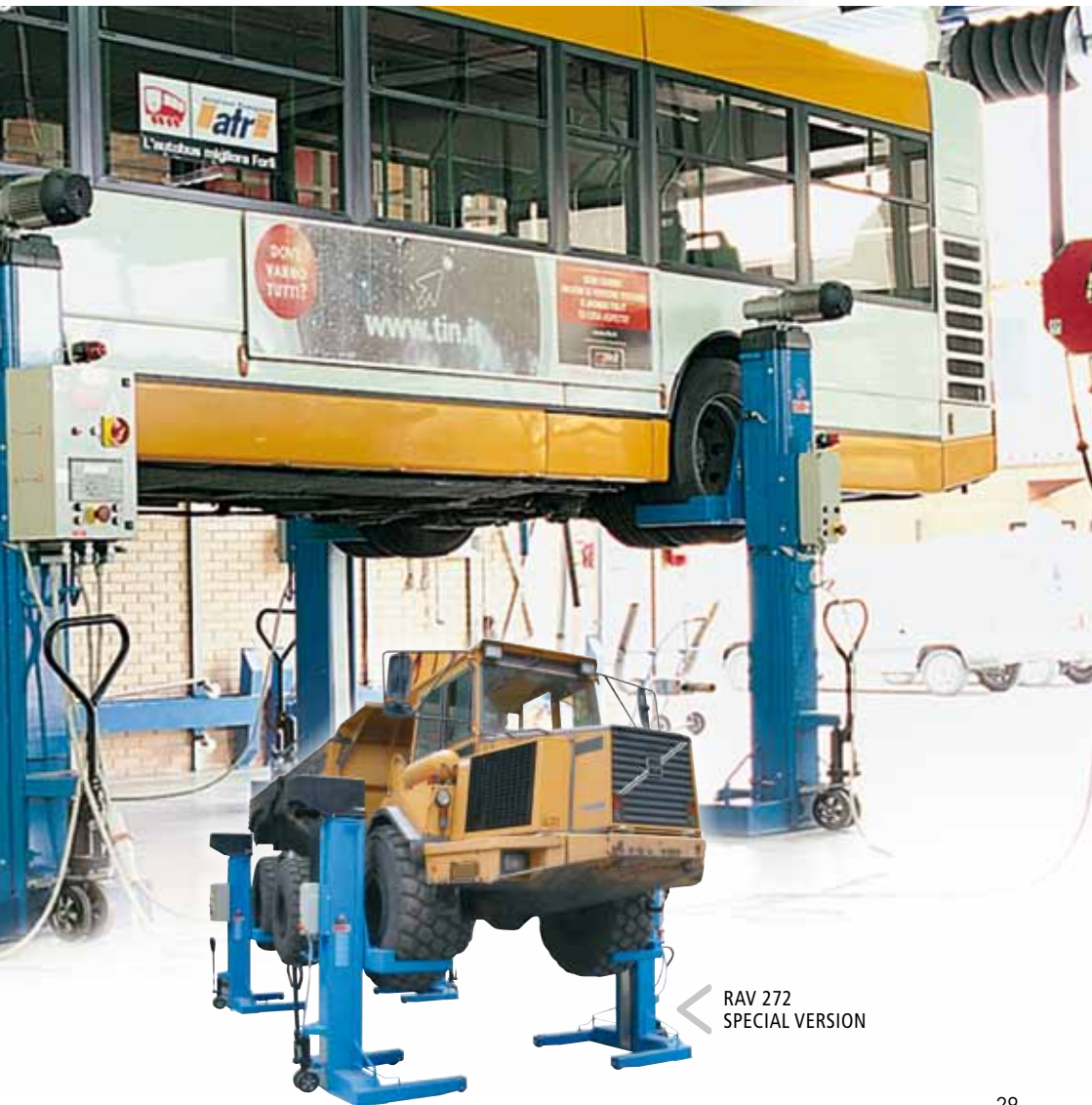
RAV 272 SPECIAL VERSION